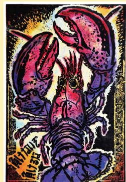
海の中のお話1(ロブスター)2015